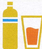
PIJ WODĘ PRZEGOTOWANĄ LUB BUTELKOWANĄ