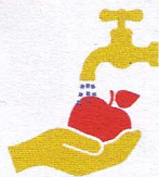
MYJ WARZYWA I OWOCE