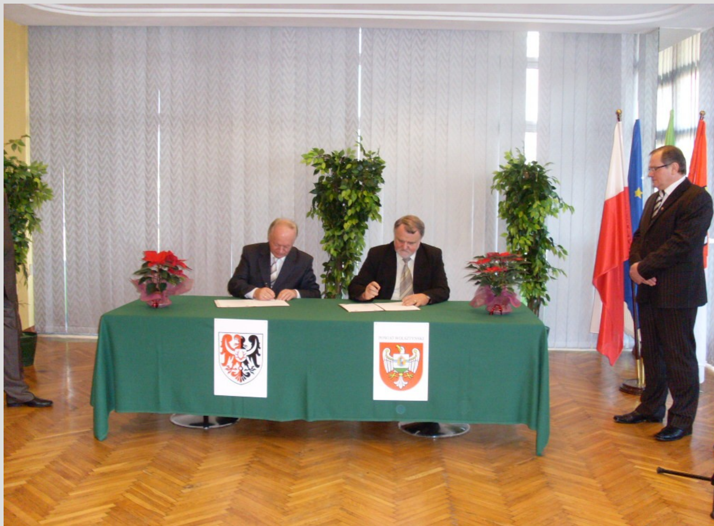
Starosta Wolsztyński Ryszard Kurp i Starosta Jeleniogórski Jacek Włodyga