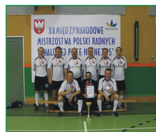
Finaliści XII Międzynarodowych Mistrzostw Polski Radnych: