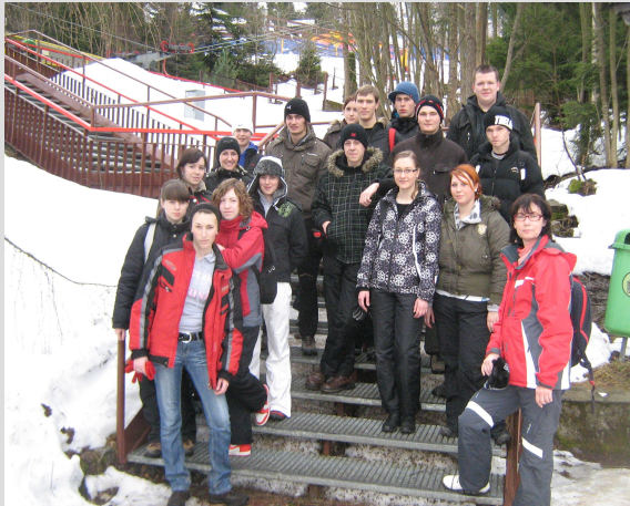
Młodzież z powiatu wolsztyńskiego w Karpaczu - 2011