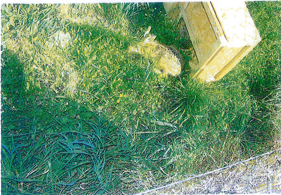
Ryc. 13. Wypuszczanie zajęcy w zagrodzie adaptacyjnej na obwodzie łowieckim nr 354