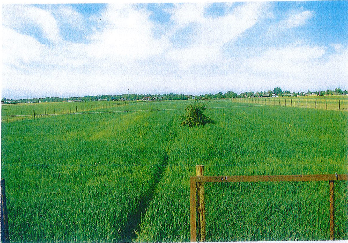
Ryc. 12. Zagroda adaptacyjna dla zajęcy na obwodzie łowieckim nr 354 (Źródło: Starostwo Powiatowe w Wolsztynie).