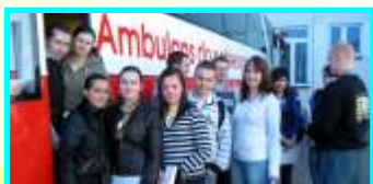
W Zespole Szkół Zawodowych w Wolsztynie