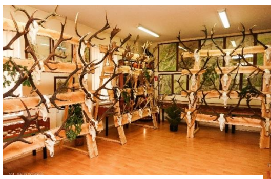
zdj. nr 5 Wystawa pozyskanych trofeów myśliwskich.

Wystawie Pozyskanych Trofeów w Muzeum Pożarnictwa w Rakoniewicach. Wystawa była licznie odwiedzana nie tylko przez mieszkańców Rakoniewic ale także przez wszystkich sympatyków i miłośników przyrody.