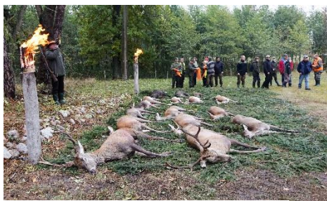
zdj. nr 7 Pokot pozyskanej zwierzyny..