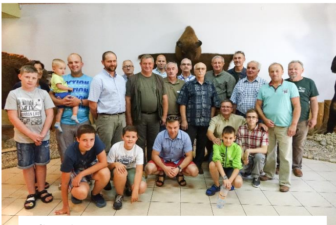
zdj. nr 3 Członkowie Koła wraz z młodzieżą szkolną.

Wystawie Pozyskanych Trofeów w Muzeum Pożarnictwa w Rakoniewicach. Wystawa była licznie odwiedzana nie tylko przez mieszkańców Rakoniewic ale także przez wszystkich sympatyków i miłośników przyrody.