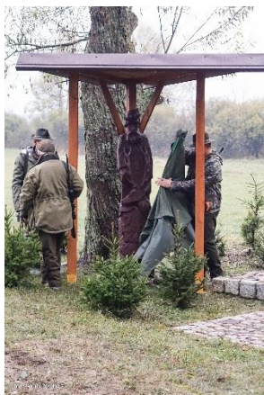
zdj. nr 5 Odsłonięcie figur Św. Huberta.

Z okazji tego dostojnego „kamiennego” Jubileuszu Koło w październiku zorganizowało uroczyste polowanie z ambon. Polowanie zostało poprzedzone odsłonięciem figury Św. Huberta, która znalazła się obok