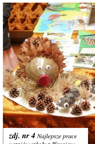
zdj. nr 4 Najlepsze prace uczniów szkoły z Wroniaw.

Uzarzewie z udziałem młodzieży szkolnej. Myśliwi Koła zajmują się nie tylko gospodarką łowiecką, ale również propagują nauki o myślistwie wśród młodzieży. Najszerzą współpracę koło nawiązało ze Szkołą we Wroniawach. Z okazji obchodów 70 lecia koła Dyrekcja i uczniowie Szkoły Wroniawy zorganizowali konkurs plastyczny. Najlepsze prace zostały wystawione na zorganizowanej przez Koło