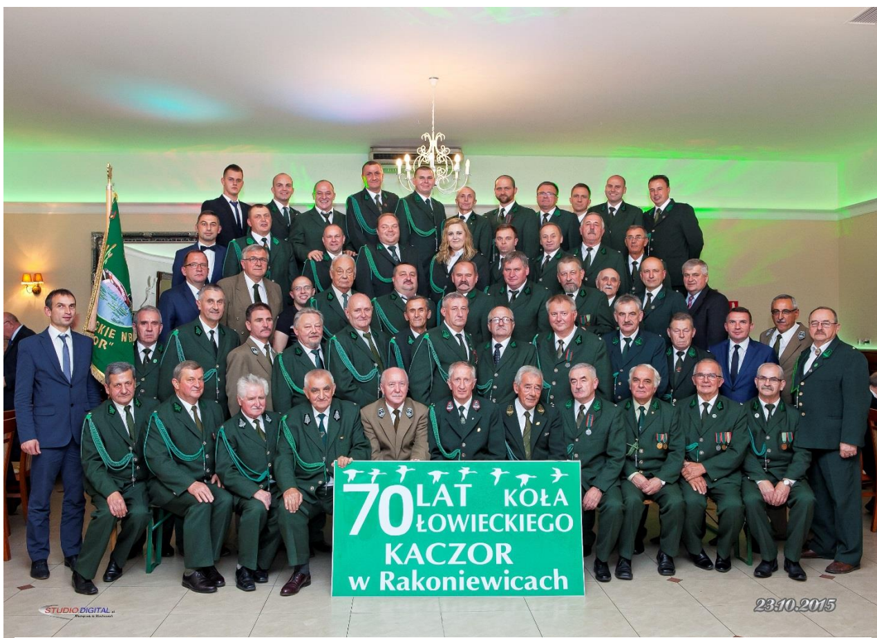
zdj. nr 11 członkowie Koła wraz z zaproszonymi gośćmi: