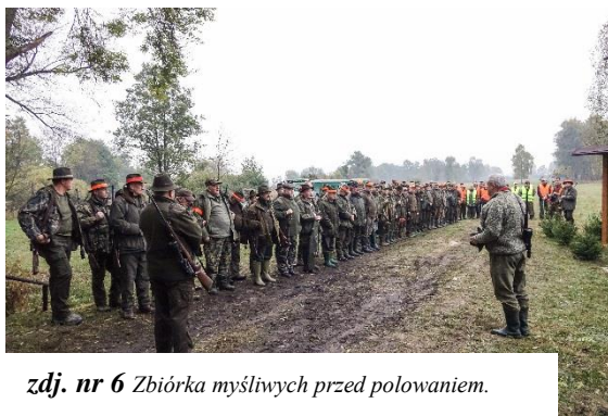
zdj. nr 6 Zbiórka myśliwych przed polowaniem.

istniejącego obelisku przy tzw. „Piwnicy”. Jest ona podarunkiem od kolegów z sąsiednich Kół na pamiątkę 70 lecia Koła Kaczor. Odsłonięcia dokonali Przewodniczący Okręgowej Rady Łowieckiej w Poznaniu oraz Przewodniczący